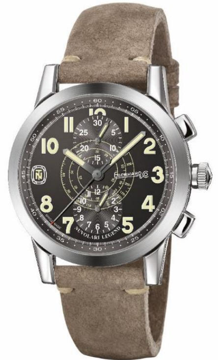
Nuvolari Legend -Novità 2018

Questa collezione si rinnova continuamente e si arricchisce di preziose referenze anno dopo anno. La novità più recente è rappresentata da: